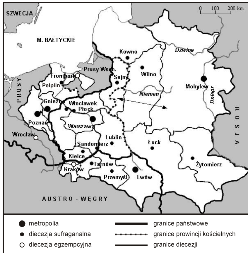
Rys. 5. Struktury diecezjalne na ziemiach polskich w 1890 r.

Wigrach (1798 r.), Mińsku (1798 r.), Żytomierzu (1798 r.), Kielcach (1805 r. i ponownie w 1882 r.), Janowie Podlaskim (1818 r.), Sandomierzu (1818 r.) oraz Tyńcu (1821 r.). W kilku przypadkach dokonano translokacji stolic diecezjalnych: Chełm – Lublin (1805 r.), Wigry – Sejny (1818 r.) oraz Tyniec – Tarnów (1826 r.). Klęski zrywów powstańczych zadecydowały ponadto o kasacie przez carat 3 diecezji: w Kamieńcu Podolskim, Mińsku i Janowie Podlaskim (1866–1869). W każdym przypadku starano się adaptować w pełni zasięg oddziaływania poszczególnych biskupstw (zarówno tych dawnych, jak i nowych) do granic politycznych państw zaborczych (Kumor, Obertyński 1979). Doprowadzono także do całkowitego rozbicia dotychczasowej struktury metropolitalnej.