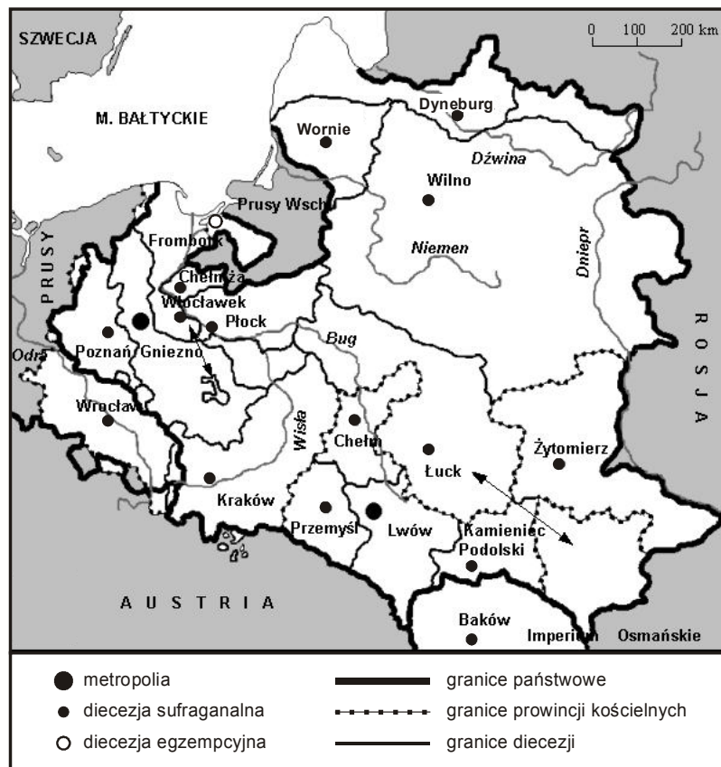
Rys. 4. Struktury diecezjalne na ziemiach polskich w 1772 r.

Trzeci etap rozwoju struktur diecezjalnych na ziemiach polskich obejmuje okres od XV w. do 1772 r., tj. początku procesu upadku Rzeczypospolitej (rys. 4). Był to okres względnej stabilizacji polskiej organizacji eklezjalnej, charakteryzujący się sukcesywną rozbudową struktur wewnątrzdiecezjalnych oraz dość dużą autonomią, choć mniejszą aniżeli w wielu państwach zachodnioeuropejskich, co wynikało ze spóźnionej recepcji reform gregoriańskich oraz specyficznej sytuacji politycznej na ziemiach polskich (Tazbir 1966).