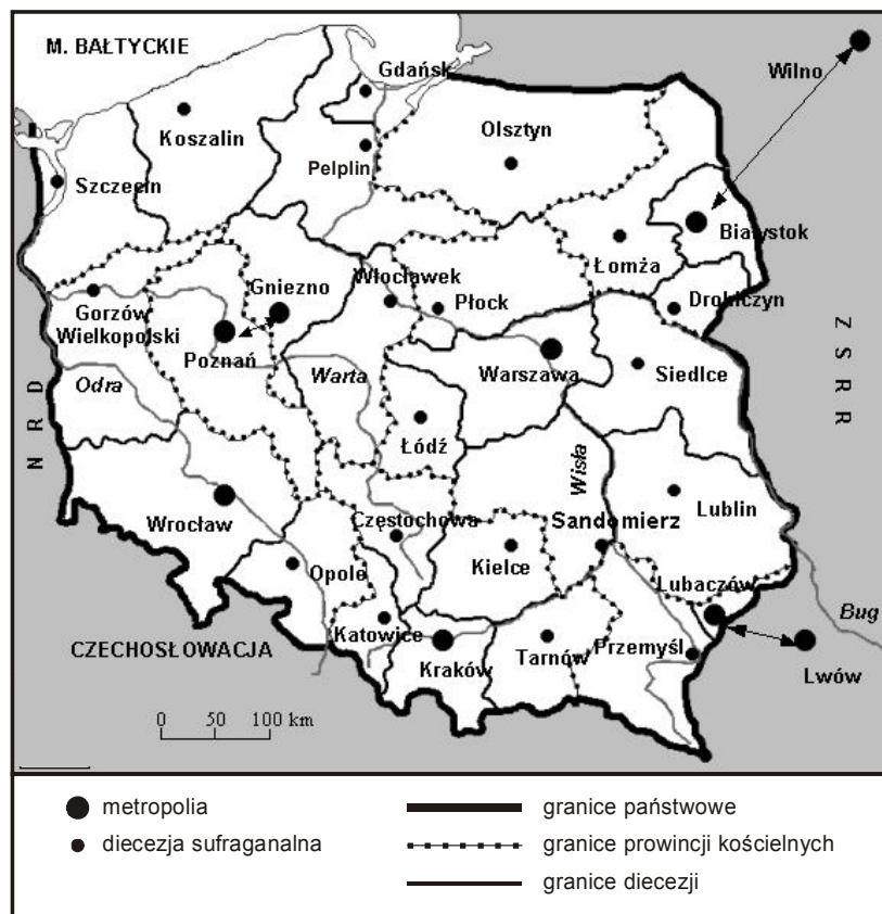
Rys. 7. Struktury diecezjalne na ziemiach polskich w 1972 r.

erekcji diecezji opolskiej, gorzowskiej, szczecińsko-kamińskiej oraz koszalińsko-kołobrzeskiej (Cywiński 1980, Żaryn 2003). Erygowano ponadto nową prowincję kościelną z siedzibą we Wrocławiu, której podporządkowano diecezje gorzowską i opolską. Biskupstwo gdańskie, koszalińsko-kołobrzeskie oraz szczecińsko-kamińskie uzyskało zwierzchność Gniezna, Warmia zaś podlegała odtąd metropolii warszawskiej (Zdaniewicz 1983).