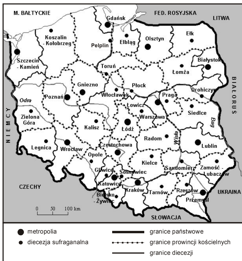
Rys. 8. Struktury diecezjalne na ziemiach polskich w 1992 r.

czerwca 1991 r., papież Jan Paweł II zmienił status dwóch jednostek eklezjalnych, ustanawiając archidiecezję białostocką i diecezję drohiczyńską (Zieliński 2003). Konsekwencją zainicjowanych zmian była ogłoszona 25 marca 1992 r. przez papieża bulla Totus Tuus Poloniae populus , która w zasadniczy sposób zmieniła administracyjne oblicze Kościoła w Polsce (rys. 8).