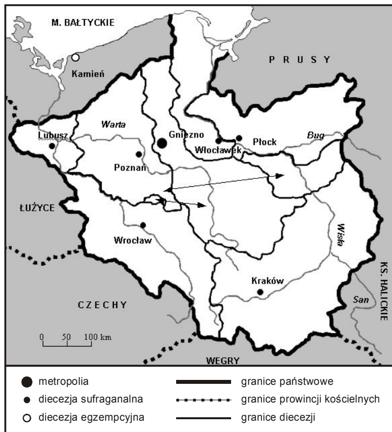
Rys. 2. Struktury diecezjalne na ziemiach polskich w połowie XII w.

a zatem do początków rozbicia dzielnicowego kraju. Był to okres stopniowej stabilizacji struktur terytorialno-organizacyjnych Kościoła i rozwoju ad intra stymulowanego czynnikami endogenicznymi. Doszło wówczas do sukcesywnego wypełniania przestrzeni nowymi jednostkami eklezjalnymi i osiągnięcia fazy instytucjonalizacji ustroju terytorialnego Kościoła w Polsce. Za sprawą działalności Kazimierza Odnowiciela nastąpiła restytucja zlikwidowanych wcześniej jednostek diecezjalnych, a za czasów jego następcy Bolesława Śmiałego odnowiono metropolię w Gnieźnie. Jednocześnie utworzone zostało w 1075 r. nowe biskupstwo z siedzibą w Płocku, a na początku XII w. prawdopodobnie nastąpiła translokacja stolicy biskupiej z Kruszwicy do Włocławka (Labuda 2004).