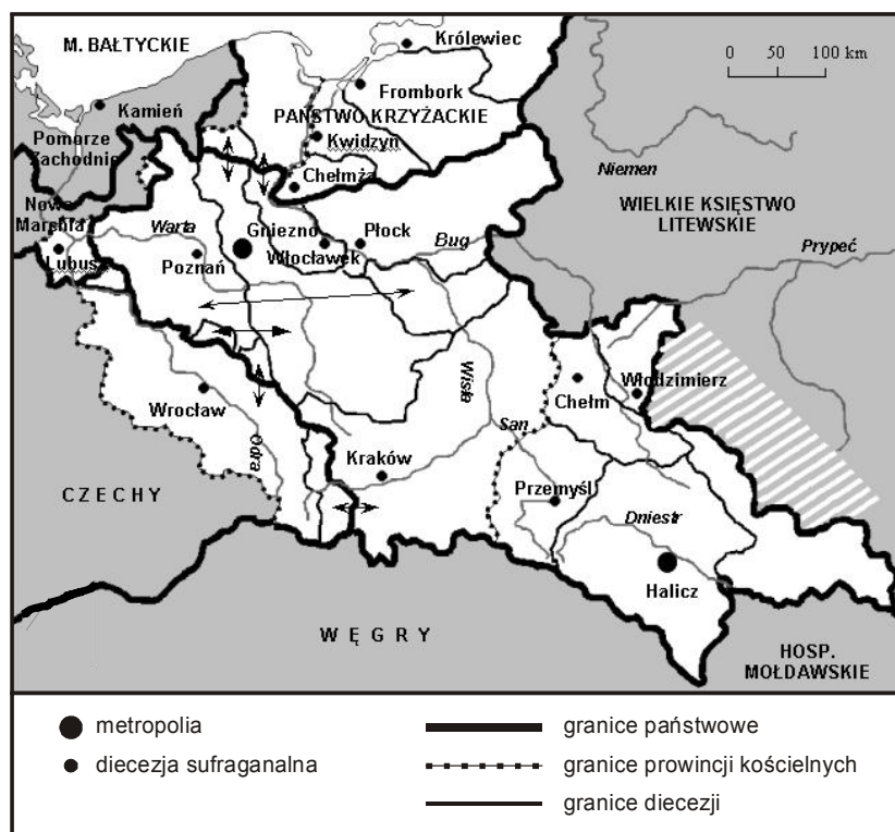
Rys. 3. Struktury diecezjalne na ziemiach polskich w 1375 r.

została Ruś Czerwona (rys. 3). W 1375 r. mocą bulli Debitum pastoralis officii erygowana została metropolia halicka, której podporządkowano diecezję w Przemyślu, Chełmie i Włodzimierzu (Abraham 1904). Wkrótce nowej prowincji podporządkowano również biskupstwo mołdawskie w Serecie, które jednak na początku XVI w. uległo zanikowi. Po aneksji Podola utworzona została diecezja w Kamieńcu (ok. 1380 r.), kolejno (ok. 1400 r.) w Kijowie oraz w Łucku, połączona w 1425 r. z biskupstwem włodzimierskim. Po translokacji stolicy prowincji kościelnej z Halicza do Lwowa w 1414 r. ustrój metropolitalny w Polsce przedrozbiorowej był już zakończony (Kumor 1969–1972). Sojusz Polski i Litwy zwieńczony unią w Krewie doprowadził do katolicyzacji rodzimego kraju dynastii jagiellońskiej (Kłoczowski 1987). Zaowocowało to erekcją dwóch nowych diecezji podporządkowanych następnie metropolii gnieźnieńskiej: wileńskiej – w 1387 r. i żmudzkiej – w 1421 r. (Błaszczyk 1993).