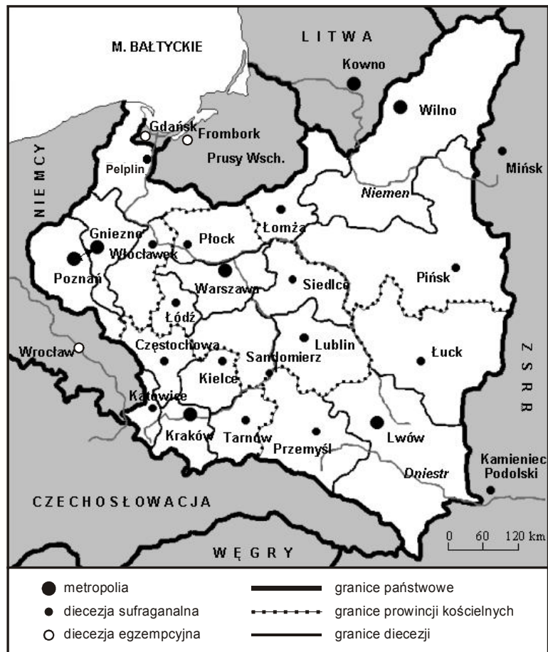
Rys. 6. Struktury diecezjalne na ziemiach polskich w 1926 r.

i Włocławek, metropolia warszawska: Warszawę, Lublin, Łódź, Sandomierz, Siedlce i Płock; metropolia lwowska zaś: diecezje z siedzibą we Lwowie, Łucku i Przemyślu. Wszystkie diecezje otrzymały nowe granice (rys. 6), które zgodnie z konkordatem (1925 r.) zostały dostosowane do politycznych granic państwa (Wisłocki 1977). Rozwój struktur eklezjalnych w omawianym okresie, choć znaczący, nie był w pełni zadowalający. Pozostawał nadal problem rozległych terytorialnie i ludnościowo diecezji (np. Lublin, Lwów, Poznań, Wilno). Postulat zacierania granic zaborczych przeprowadzono w niewielkim stopniu, a usytuowanie niektórych siedzib biskupich pozostawało wiele do życzenia, np. Sandomierz (Kumor, Obertyński 1979).