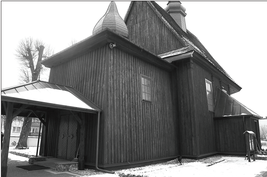
1. Rembieszyce. Kościół parafialny – widok od strony południowo-wschodniej. Fot. Małgorzata Karkocha, 2018

Keywords: Rembieszyce, parish church, history of the Church, source edition, 19 th century.