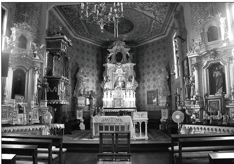
2. Rembieszycy. Wnętrze kościoła – widok na prezbiterium