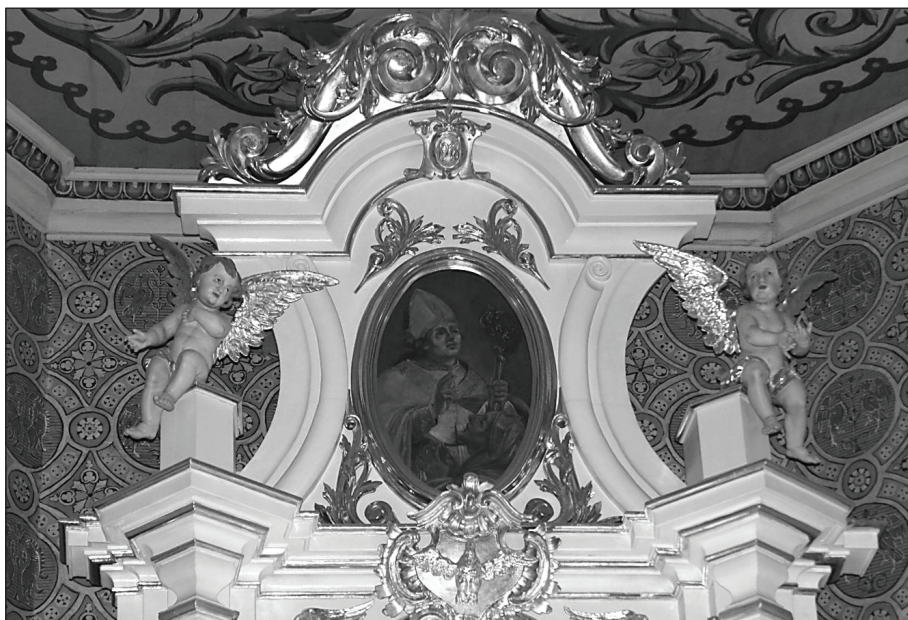
3. Michał Stachowicz, Św. Stanisław – obraz w zwieńczeniu ołtarza głównego. Fot. Małgorzata Karkocha, 2018