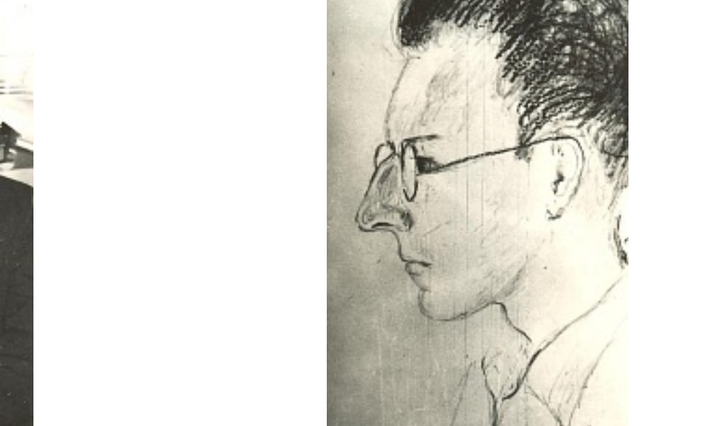
karykatura autorstwa Anieli Burdyńy

W 1958 wstąpił na stanowisko kierownika biblioteczki w 1957 - Biblioteczka dyplomatyczna, za co był wielokrotnie nagradzany przez Rada UMK. W 1974 - kustosa dyplomowanego, a w 1981 starszego kustosa dyplomowanego. Od 1973 był kierownikiem Oddziału Udośpienia Zbiorów. W latach 1981-1984 pełnił funkcję zastępcy dyrektora BUL. Na tym stanowisku prowadził sprawy pracownicze Biblioteki Głównej i bibliotek zaakadlowych. Od 1984, po zakończeniu kariery naukowej, kierownikiem Oddziału Udośpienia Zbiorów. Od 1982 był członkiem Komisji ds. Gromadzenia i Uzupełniania Zbiorów oraz Komisji ds. Nagród, Awansów i Odznaczeń w BUL.