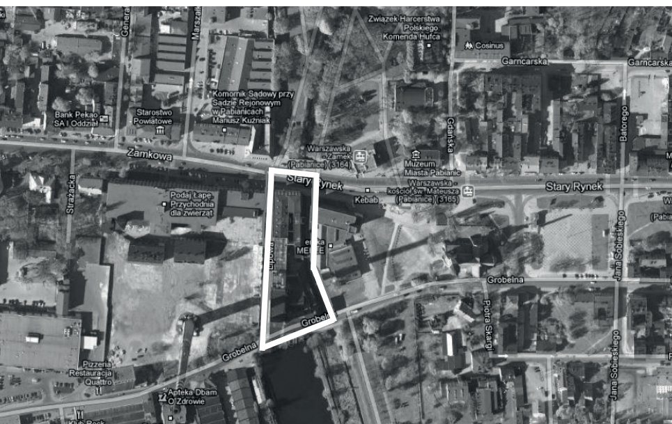
Lokalizacja kompleksu poprzemysłowego dawnej „Pawelany” w Pabianicach

Miasta Konstanytnów Łódzki oraz Pabianice (które służą za przykład przebiegu procesów rewitalizacyjnych w aglomeracji łódzkiej) to dwa ośrodki miejskie o podobnej historii rozwoju. W pierwszym z miast autor skupił się na przedstawieniu rewitalizacji przestrzeni i obiektów na niej się znajdujących (Plac Kościuszki)(rysunek 1), natomiast w drugim na rewitalizacji obiektu oraz otaczającej go przestrzeni (kompleks poprzemysłowy dawnej „Pawelany”)(rysunek2).