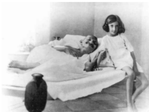
Zdjęcie nr 8: Otoczenie polityczne Indiry nieprzypadkowo podkreślało w jej biografii wątek znajomości z „Ojcem Narodu”, M. K. Gandhim