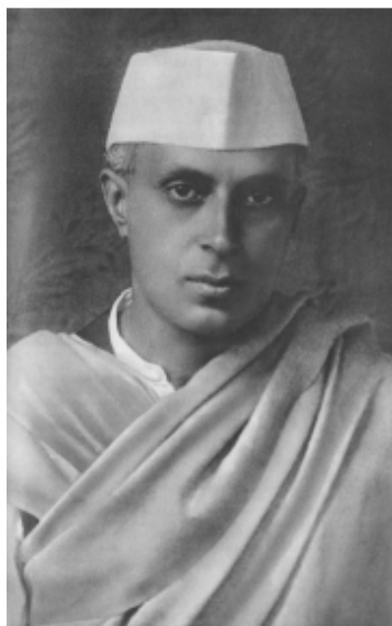
Zdjęcie nr 3: Jawaharlal Nehru (1889–1964) w 1919 r. Współzałożyciel dynastii Nehru-Gandhi.