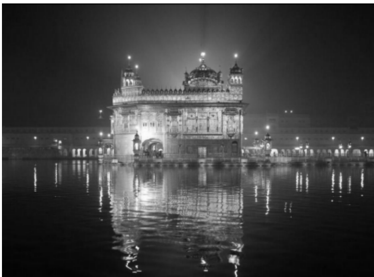
Zdjęcie nr 12: Złota Świątynia w mieście Amritsar (pendż. Sadażawka nektaru nieśmiertelności), zwana Darbar Sahib (Dwór Pana) lub Harmandir (Świątynia Boża), w której przechowywany jest oryginał świętej księgi Sikhów. To jej spacyfikowanie w dniach 5–7 VI 1984 r. stanowiło początek tragicznego końca Indiry Gandhi 31 X 1984 r.