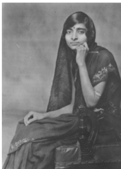
Zdjęcie nr 2: Matka przyszłej pani premier Kamala Nehru 1899-1936