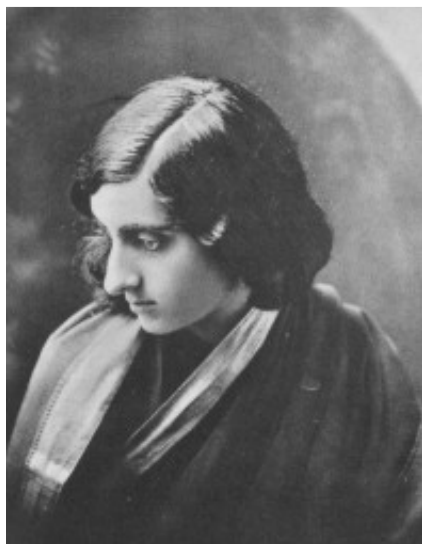
Zdjęcie nr 1: Indu Priyadarshini, nazwana zgodnie z wolą ojca - Indu - księżyc, Priyadarshini - droga oczom; do historii przeszła jako Indira Gandhi