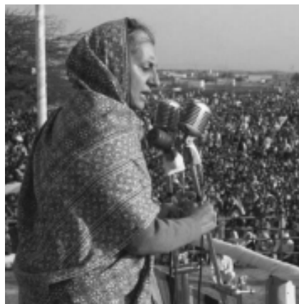
Zdjęcie nr 9: „...proweniencja tej postaci, jak i rewolucyjny program społeczny, przysporzyły jej mandat jakiego nie notowano od czasów Mahatmy...”