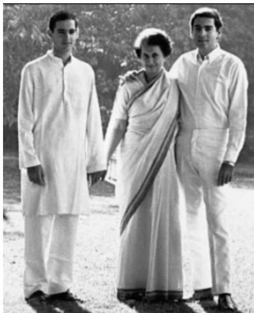
Zdjęcie nr 13: Rajiw (1944–1991), Indira, Sanjay (1946–1980). Cała rodzina zginęła tragicznie: Sanjay w katastrofie lotniczej, pilotowanego przez siebie, samolotu w czerwcu 1980 r.; Indira 31 X 1980 r. z rąk własnych ochroniarzy, zaś Rajiw padł ofiarą zamachu, zorganizowanego przez ugrupowanie Tamilskich Tygrysów w maju 1991 r.