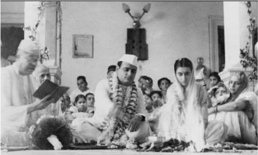
Zdjęcie nr 5: Ślub z Indiry z Firozem w 1942 r. przez niektórych był postrzegany jako mezalians, ponieważ zięć J. Nehru wyznawał zoroastryzm i nie wywodził się z bramińskiej kasty jak Indira