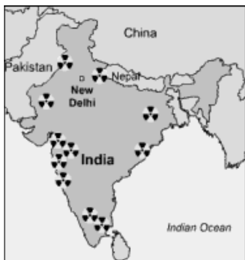
Zdjęcie nr 10: „...jednakże fakt zainicjowania pod jej rządami programu nuklearnego w 1967 r., stanowił dowód na „przepaść” ideową między nią, a twórcą satyagrahy . Oficjalnym powodem podawanym przez rząd była reakcja na rozpoczęcie analogicznego programu atomowego przez CHRL”.