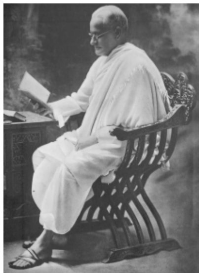
Zdjęcie nr 4: Motilal Nehru (1861–1931) w 1919 r. Współzałożyciel dynastii Nehru-Gandhi.