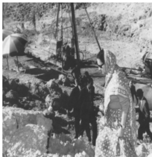
Zdjęcie nr 11: Projekt „pokojoyej próby jądrowej” otrzymał przewrotny kryptonim Smiling Buddha . Na zdjęciu pani premier zwiedza miejsce, w którym 18 V 1974 r. dokonano pierwszej detonacji – Pokhan