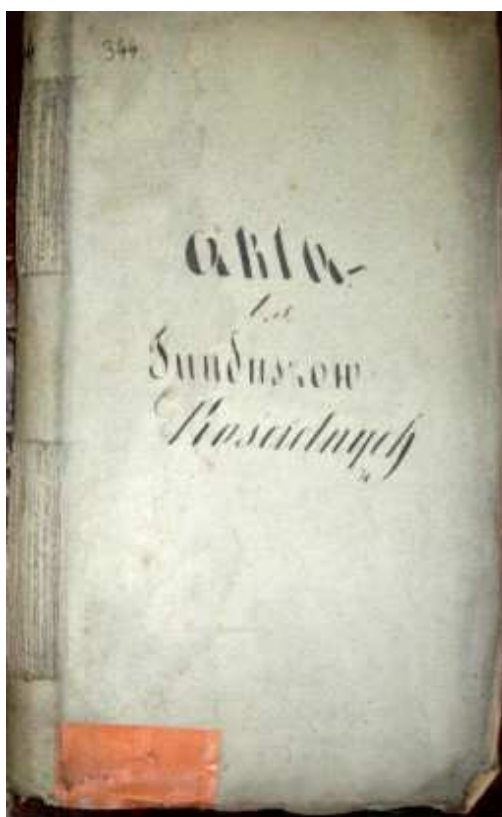
Fot. 5. Obwoluta poszytu akt dziekańskich

skiego dotyczący zobowiązań rządu Księstwa Warszawskiego, które przejął rząd Królestwa Polskiego, reskrypt Komisji Rządowej Wyznań Religijnych i Oświecenia Publicznego na temat regulacji zobowiązań finansowych Austrii, wynikających z dostaw dla wojska, stanowiący załącznik do pisma Konsystorza Generalnego Kaliskiego, reskrypt Komisji Rządowej Spraw Wewnętrznych i Policji dotyczący zobowiązań finansowych Prus, wynikających z obligacji wobec mieszkańców Królestwa Polskiego, stanowiący załącznik do pisma komisarza obwodu sieradzkiego, rozporządzenie administratora diecezji kujawsko-kaliskiej w sprawie przesłania wykazu praw i funduszków kościelnych znajdujących się w Galicji, stanowiące załącznik do pisma Konsystorza Generalnego Kaliskiego.