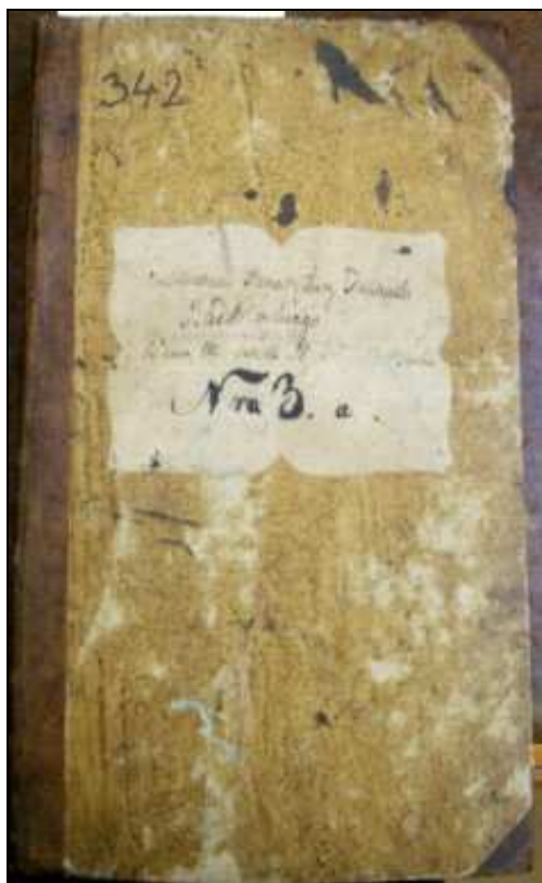
Fot. 3. Okładka dziennika dziekańskiego

[miesiąca] st[ycznia] 1841 roku. Nro 3. a. Podobnie jak wcześniejszy dziennik, jednostkę stanowi księga składająca się z nieliczbowanych kart w twardej tekturowej oprawie. Druga księga dziennika przewidywała zredukowaną wersję rubryk z pierwszej księgi, tzn. jedynie kolumny 1–5, na których w układzie chronologicznym wpisywano pisma odbierane i wysyłane.