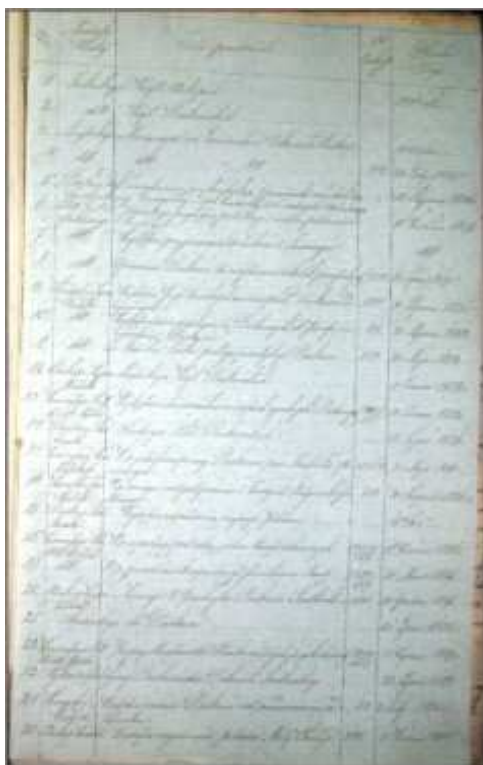
Fot. 4. Regest dokumentów znajdujących się w poszycie

dokumentów nie wyczerpuje zawartości jednostki, brak w nim ok. 20 pism z lat sześćdziesiątych XIX w., wszytych na końcu poszytu. Numery pism, zawarte w rejestrze, są zwykle w lewym górnym rogu karty.