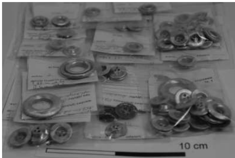
Ryc. 9. Góra Skarzawa, st. 1. Wykop nr 2. Guziki i przelotki niemieckiego wyposażenia wojskowego z I wojny światowej. Stan po konserwacji