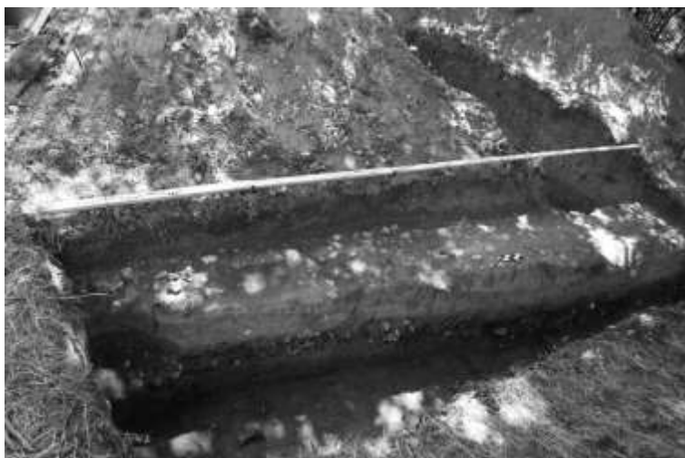
Ryc. 6. Góra Skarzawa, st. 1. Wykop nr 1 i 1a. Relikt brukowanej drogi. Widok od strony północno-zachodniej