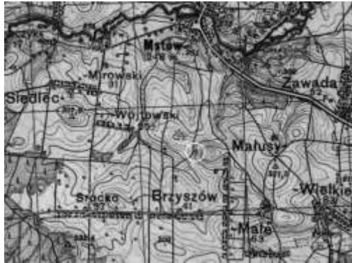
Ryc. 4. Góra Skarżawa (zachodnie zbocze) z zaznaczonym krzyżem (w białym kółku) na Mapie taktycznej Polski z 1933 r.