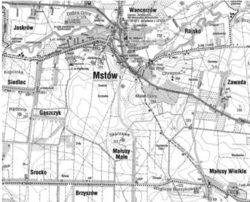
Ryc. 1. Góra Skarzawa (na północ od Małus Małych) na mapie turystycznej wydawnictwa Kartogram (oprac. D. Faustamann)