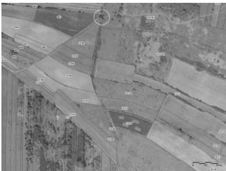
Ryc. 7. Góra Skarzawa (zachodnie zbocze) z zaznaczonym miejscem odkrycia brukowanej drogi (w białym kółku) oraz biegnącym w kierunku południowym jarem, reliktem dawnej drogi, na zdjęciu satelitarnym z zaznaczonym podziałem katastralnym