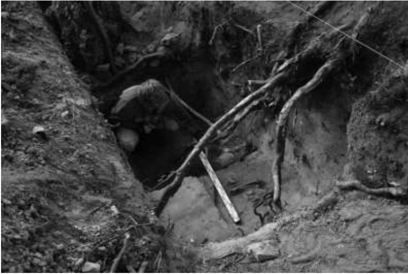
Ryc. 10. Góra Skarzawa, st. 1. Wykop nr 2. Mgr Tomasz Stefańczyk podczas dokumentacji odkrytych ludzkich szczątków kostnych. Widok od strony północno-wschodniej (fot. O. Ławrynowicz)