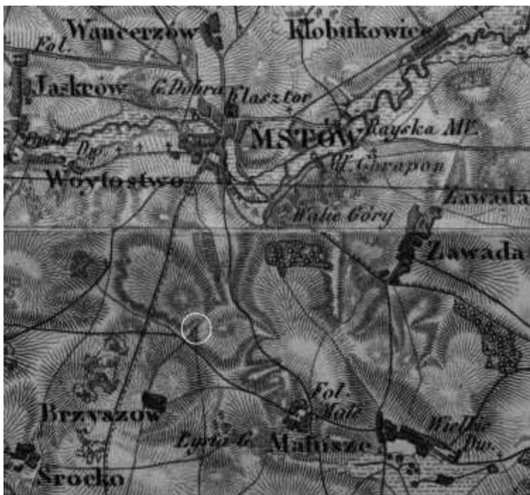
Ryc. 8. Góra Skarzawa (zachodnie zbocze) z zaznaczonym miejscem odkrycia brukowanej drogi (w białym kółku) oraz biegnącą w kierunku południowym, nieużywaną dziś drogą na Topograficznej Karcie Królestwa Polskiego z lat. 30. XIX w. Połączone karty CP-12, Kol II, Sek VI, Wieluń-Radomsko i CP-13, Kol II, Sek, VII, Siewierz-Żarki