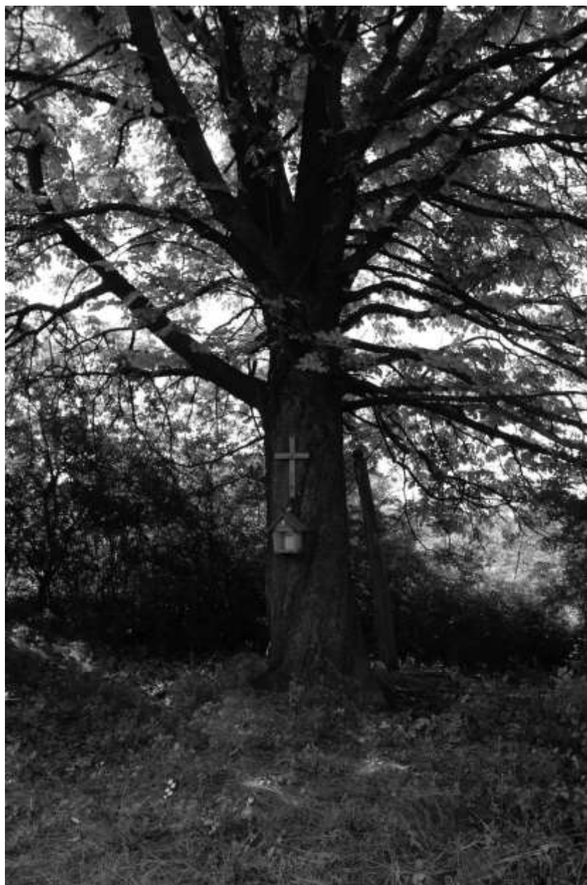
Ryc. 3. Góra Skarzawa (zachodnie zbocze). Kasztanowiec z przymocowaną kapliczką oraz stojącym obok reliktem drewnianego krzyża. Widok od strony północnej; czerwiec 2015 r.