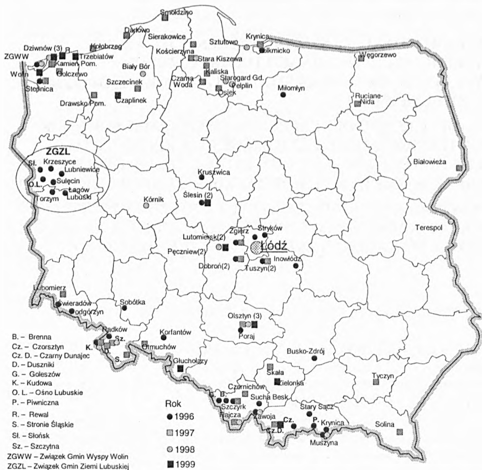
Rys. 1. Gminy, w których praktyki specjalnościowe odbywali studenci II roku GTiH UŁ w latach 1996–1999

Terenem ćwiczeń jest gmina turystyczna wiejska, małomiasteczkowa (do 10 tys. mieszkańców) lub kilka gmin zrzeszonych w związku albo stowarzyszeniu turystycznym, np. „Turystyczna Szóstka” zrzeszająca gminy leżące w Kotlinie Kłodzkiej.