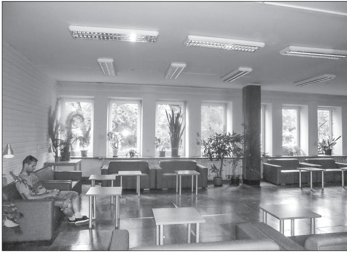
Fot. 6. Strefa wypoczynku BUŁ