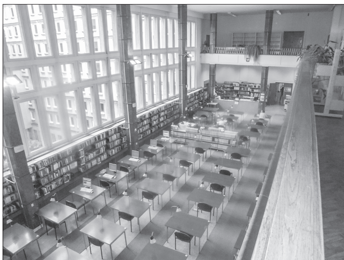
Fot. 5. Czytelnia Historyczna BUŁ

Nowy gmach stał się miejscem organizowania wielu wystaw urządzanych w holu i w galeriach na trzech kondygnacjach. Każdego roku odbywa się kilkanaście takich imprez przygotowanych przez pracowników Oddziału Informacji Naukowej BUŁ oraz przez instytucje zewnętrzne takie jak: Filharmonia Łódzka im. Artura Rubinsteina, Muzeum Książki Artystycznej, Łódzki Oddział Związku Literatów Polskich czy Łódzkie