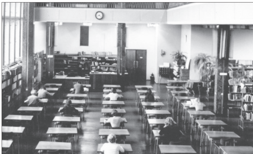
Fot. 2. Czytelnia Główna BUŁ