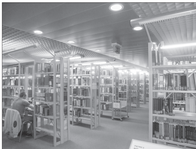
Fot. 3. Strefa Wolnego Dostępu BUŁ

Zapewnienie czytelnikom wolnego dostępu do zbiorów wymagało zastosowania nowej technologii udostępniania, kontroli wypożyczeń, ochrony oraz zabezpieczenia przed kradzieżą. W nowym budynku Biblioteki Uniwersyteckiej wprowadzono nowoczesny system technologii radiowej RFID (Radio Frequency Identification) – połączony z komputerowym systemem bibliotecznym. W skład systemu RFID wchodzi: bramki, stacjonarne i przenośne czytniki, urządzenia do samodzielnego wypożyczania (self-check) oraz wrzutnia do samodzielnego zwrotu wypożyczonych książek. Każda publikacja ma umieszczony wewnątrz chip z zakodowaną metryką, w której znajdują się następujące dane: sygnatura KBK, numer inwentarza, nazwisko autora, tytuł książki i rok wydania. System RFID nie tylko chroni książki przed kradzieżą, ale również przyspiesza ich wypożyczanie. Czynność ta, trwająca kilka sekund, sprowadza się do umieszczenia przeznaczonego do wypożyczenia egzemplarza na pulpicie, w którym znajduje się urządzenie odczytujące dane zakodowane w chipie. System RFID ułatwia również przeprowadzanie skontrum. Do sprawdzania liczby i ustawienia książek na półkach służy specjalny czytnik.