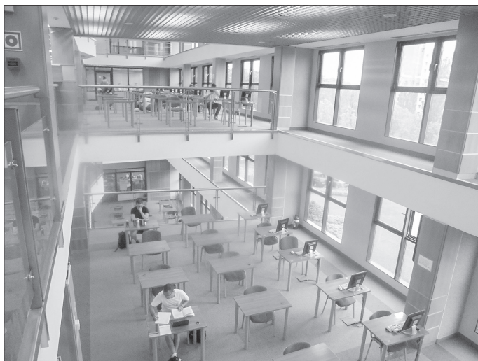
Fot. 4. Stanowiska dla czytelników w strefie Wolnego Dostępu BUŁ