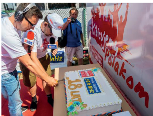
Fot. 4. Studio Radia Rajdowego w Mikołajkach

W 2014 roku, w czerwcu, Radio Olsztyn po raz osiemnasty uruchomiło Radio Rajdowe. Od czwartku do niedzieli dzięki współpracy z Polskim Związkiem Motorowym miłośnicy rajdów samochodowych mogli na bieżąco śledzić najważniejsze wydarzenia z LOTOS 71. Rajdu Polski. Każdego dnia na częstotliwości 99,6 MHz reporterzy i dziennikarze przekazywali wyniki, wypowiedzi kierowców, rozmowy z organizatorami, kibicami i gośćmi rajdu. Prowadzący podpowiadali także, jak dotrzeć do punktów widokowych, jak uniknąć korków oraz jakich zasad przestrzegać, aby kibicowanie było bezpieczne; konsekwentnie realizowali koncepcję Radia Rajdowego 28 .