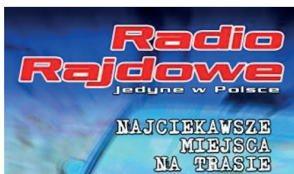
Fot. 2. Logo Radia Rajdowego

W 2005 roku Rajd Kormoran zniknął z programu Mistrzostw Polski. I jest to data graniczna. Oczywiście pozostaje wciąż w zasięgu zainteresowań dziennikarzy sportowych, ale przestał być przedmiotem narracji Radia Rajdowego. Tak się jednak złożyło i nie ma w tym przypadku, że od tego roku 66. Rajd Polski stał się prestiżową rundą mistrzostw świata i został przeniesiony do podolsztyńskich Mikołajek. Niejako naturalnie stał się punktem odniesienia. Radio Rajdowe nadało wówczas 84-godzinną audycję motoryzacyjną 23 . W latach 2005–2008 stacja nadawała na jednej z częstotliwości posiadanych przez Radio Olsztyn: 102,2 bądź 99,6. W 2009 roku Krajowa Rada Radiofonii i Telewizji ponownie przyznała dodatkową częstotliwość rozgłośni – 93,5. Radio działało także na podstawie koncesji przyznanej przez Urząd Komunikacji Elektronicznej 24 . Można go było także tradycyjnie już słuchać w Internecie na łączach akademickiej sieci Olman. Popularność sieci szybko przerosła oczekiwania nadawcy i limit 500 połączeń trzeba było zwiększyć do ponad 5 tys. Tym samym Radio Rajdowe znalazło się w pierwszej setce internetowych rozgłośni z całego świata 25 .