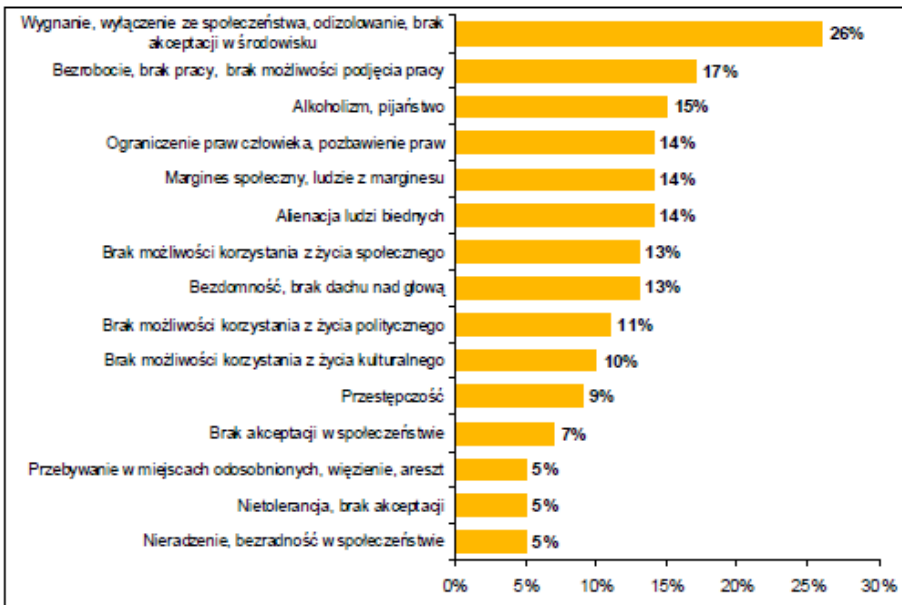
Wykres 1. Rozumienie pojęcia „wykluczenie społeczne”

gów, co powoduje, że zdefiniowanie terminu wykluczenie społeczne nie jest jednorodne. O wykluczeniu społecznym po raz pierwszy zaczęli mówić politycy, ale to socjologzy jako pierwsi zaczęli stosować ten termin, jako określenie nowego źródła nierówności 3 . Anthony Giddens odnosił to pojęcie do sytuacji, w których jednostki nie miały „możliwości pełnego uczestnictwa w społeczeństwie” 4 . Autorzy „Diagnozy społecznej 2013” wykluczenie społeczne definiują jako brak możliwości uczestniczenia jednostki lub grupy społecznej w ważnych dziedzinach życia wspólnoty, do której należą. Zauważają przy tym, że nie jest to związane z ich przekonaniami, ale z deficytami niezależnymi lub częściowo zależnymi od nich 5 . Badania przeprowadzone w 2007 r. przez PENTOR pokazują, że zdecydowana większość społeczeństwa polskiego nie rozumie terminu wykluczenie społeczne 6 .