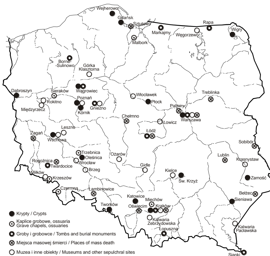
Rys. 3. Krypty, kaplice grobowe, grobowce, miejsca masowej śmierci, muzea i inne obiekty sepulkralne (opracowanie własne)

-pomniki: „Tym, co odeszli na wieczną wachtę” w Gdyni, „Tym, którzy nie powrócili z morza” w Szczecinie, tworzone w wielu miejscach symboliczne mogiły Sybiraków, Ofiar Komunizmu, Pomordowanych w Katyniu. Za niezwykły grób możemy uznać np. pomnik w formie „ręki z pepeszą” na cmentarzu wojskowym w Bornem Sulinowie.