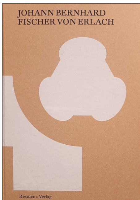
9. Okładka katalogu wystawy