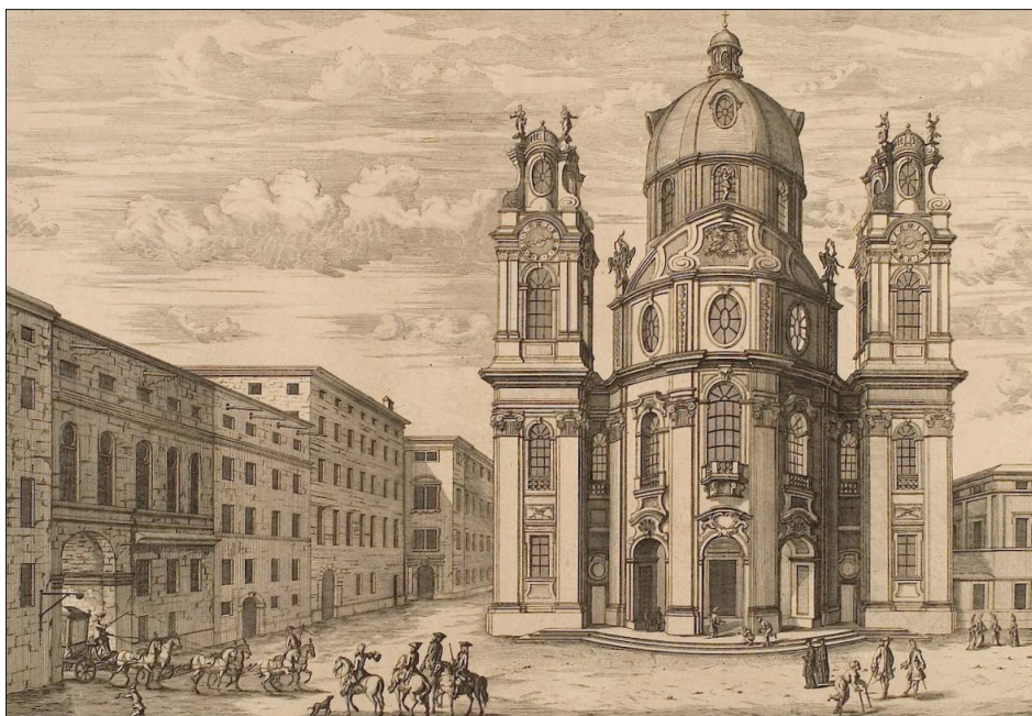
3. Kolegiata w Salzburgu, ilustracja z traktatu: Entwurf einer historischen Architectur , Leipzig 1725, t. IV