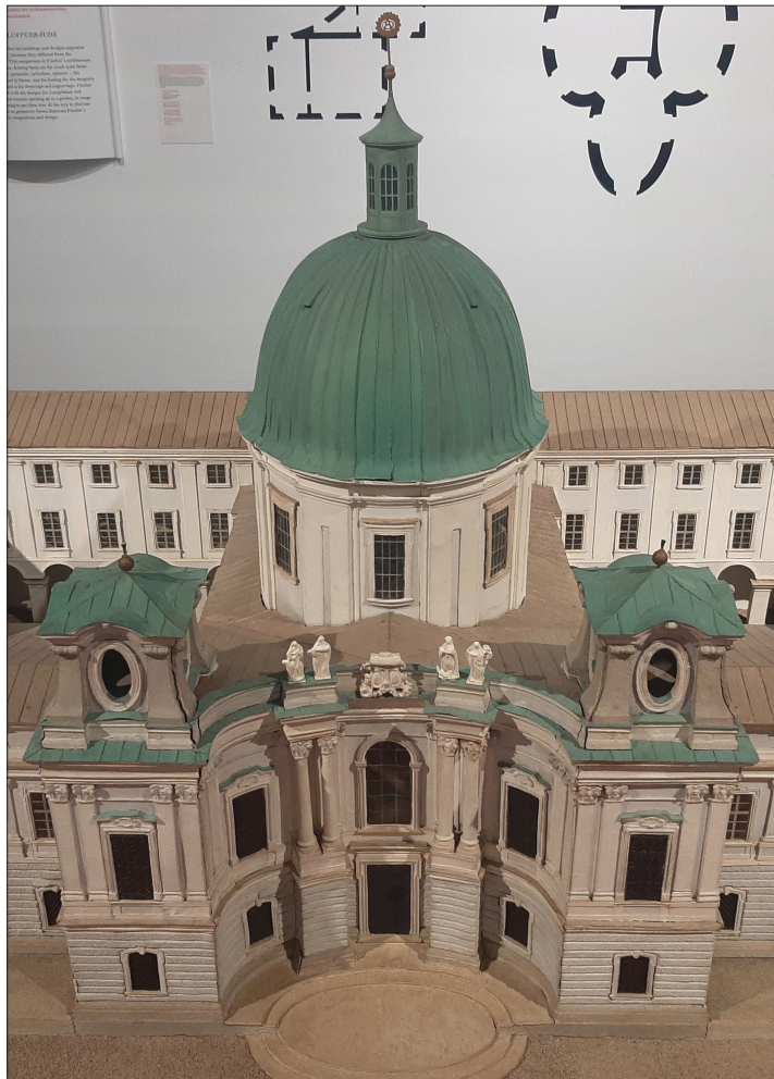
7. Model kościoła Świętej Trójcy w Salzburgu (prezentowany na wystawie), fot. autor, 2023