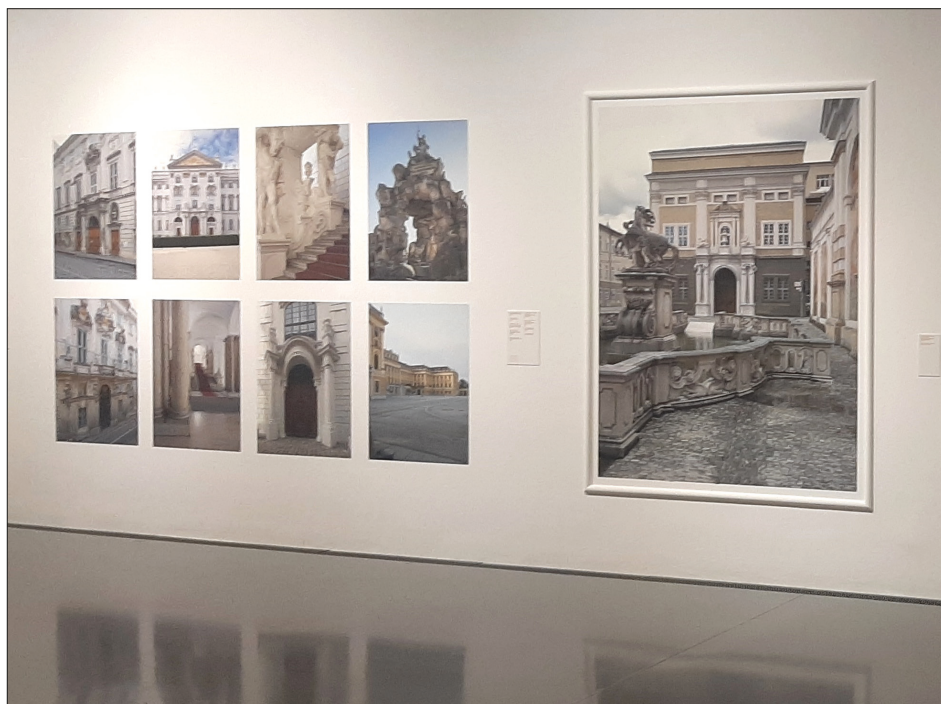
8. Fragment ekspozycji, fot. autor, 2023