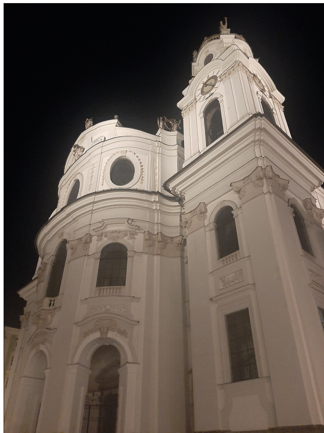
4. Kolegiata w Salzburgu, 2023