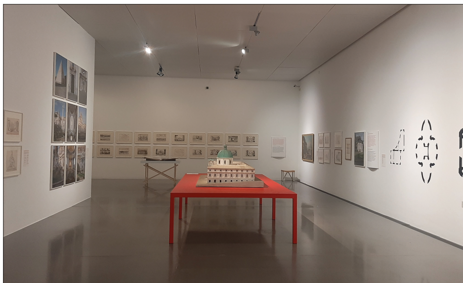
5. Wystawa poświęcona Fischerowi von Erlach – fragment ekspozycji, fot. autor, 2023