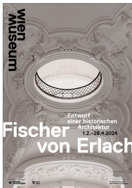
10. Plakat wystawy w Muzeum Wiednia