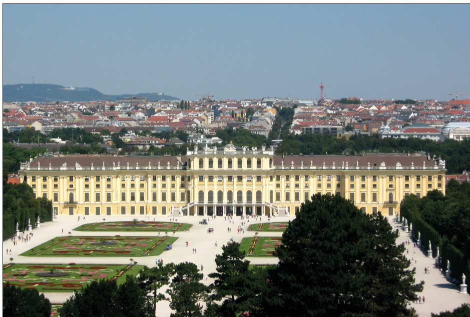
2. Założenie rezydencjonalne Schönbrunn w Wiedniu, fot. autor, 2016