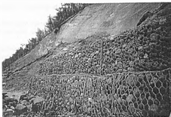
Fot. 4 . Umocnienia techniczne brzegów

Photos 4. Coastal reinforcements