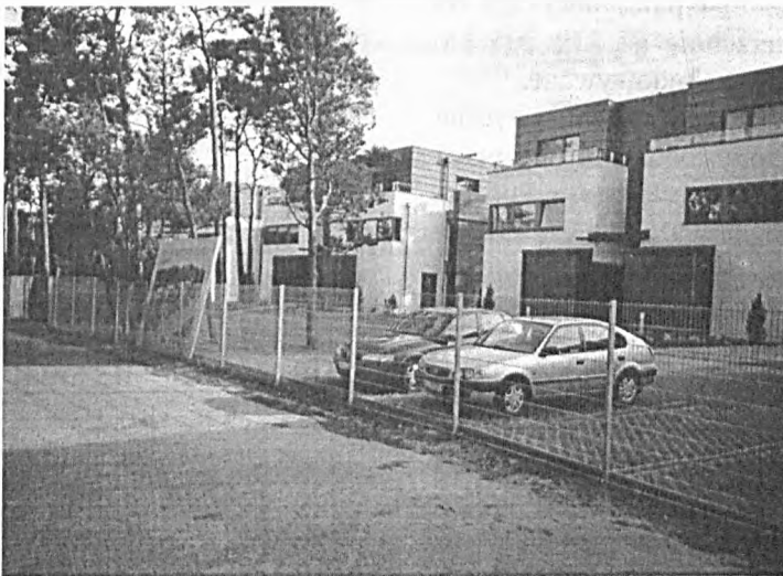
Fot. 3. Zespół apartamentowców nad brzegiem Zatoki Puckiej w Juracie