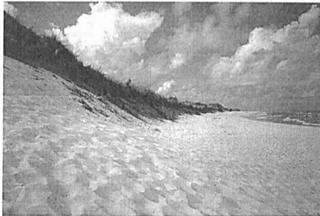
Fot. 1. Klify wydmore – powszechne w krajobrazie polskich wybrzeży mierzejowych