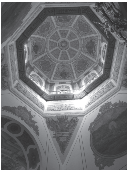
Il. 7. Kopuła nad przestrzenią centralną, (fot. autor, 2013)

Gradacja przestrzeni kościoła używana została nie tylko poprzez kulisowe traktowanie konstrukcji murów, lecz i za sprawą różnicowania ilości i rodzaju światła doprowadzanego do wnętrza. Ciemną strefą pomieszczeń wejściowych poprzedzono jasną nawę, w której równomierny rozkład walorów światłocienowych potęguje brak podziałów architektonicznych ścian. Kolejne części świątyni wprowadzają urozmaicenie źródeł i kierunków padania promieni oraz równoczesną komplikację walorów światłocienowych. Różnicowanie stopnia jasności poszczególnych stref przyczyniło się do zdefiniowania hierarchii poszczególnych przestrzeni oraz wzbogacenia ekspresji architektury.