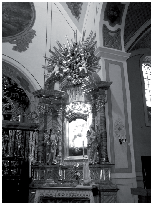
Il. 10. Ołtarz po północnej stronie łuku tęczowego, (fot. autor, 2014)

akter przekształcenia kaplicy w mauzoleum rodowe Przerębskich usankcjonował przewagę ideowego znaczenia słynącej łaskami rzeźby, której kult pozostał wiodącym celem użytkowania wnętrza. Funkcję grobową nadano wnętrzu w 1616 roku, po siedmiu latach przechowywania w nim słynącej łaskami rzeźby 59 . Dominującym elementem wyposażenia kaplic beznagrobkowych stały się ołtarze sytuowane na wprost wejścia do kaplicy 60 . Zgodność z powyższym schematem zachowano w Świętej Annie, gdzie cudowny wizerunek wkomponowano w nastawę dostawioną do północnej części muru. Deficyt materiałów źródłowych nie pozwala na rekonstrukcję wystroju pomieszczenia w XVII wieku. Inwentarze spisywane w kolejnym stuleciu również pozbawione są informacji dotyczących chorągwi lub tablic poświęconych rodzinie Przerębskich 61 . Należy jednak przypuszczać, że w kaplicy istniały detale upamiętniające ród, do których mogły należeć – widoczne w wielu realizacjach z epoki – herby wpisane w pendentywy lub motywy heraldyczne zdobiące czaszę kopuły. Otwartą kwestią pozostaje również pierwotny cha-