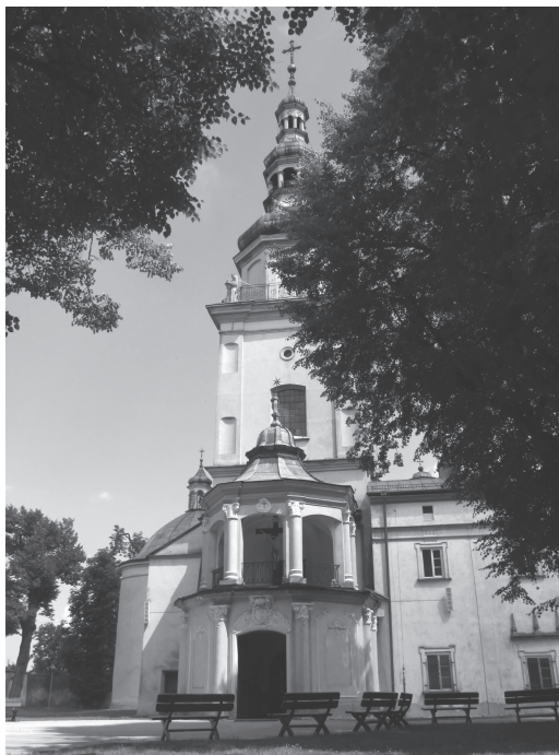
Il. 3. Elewacja zachodnia

niższych przesklepień kaplic bocznych. Czwarty akcent stanowić może sygnaturka nad chórem. Kompozycja brył stwarza ponadto wrażenie występowania piątej kopuły, hipotetycznie przysłoniętej przez środkową dominantę 27 . W konsekwencji następuje optyczna niwelacja wieży 28 . Jakkolwiek nie w pełni rozstrzygalna jest kwestia percepcji form budowli w XVII wieku, należy założyć, że tetrakonchos mógł wywoływać skojarzenia z grobowcem Matki Boskiej w Jerozolimie 29 oraz z centralizującymi świątyniami maryjnymi z terenu Włoch 30 .