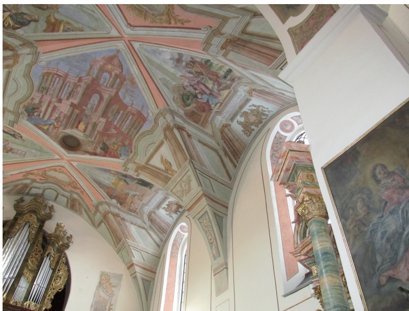
Il. 9 Sklepienie nawy, (fot. autor, 2013)