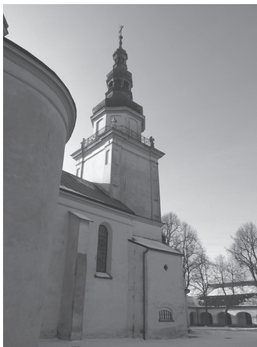
II. 8. Widok na nawę i wieżę od strony północnej, (fot. autor, 2014)

środkowej, pozwoliły na nakrycie półkuliście zamkniętych kaplic kopułami z latarniami. Brak tożsamego charakteru elementów, którymi posłużono się w poszczególnych fragmentach świątyni, uwarunkowany był odmiennymi wyzwaniami konstrukcyjnymi. Materiały źródłowe pozwalają na określenie czasu ich powstania na pierwszą ćwierć XVII stulecia 50 . Istnienie kopuły nad kaplicą północną potwierdza zapis z 1651 roku, dokumentujący przekazanie przez Barbarę Przerębską 2000 złotych na pokrycie jej ołowianą blachą 51 . Hipotezy dotyczące wzniesienia nowych kopuł w drugiej połowie XVII stulecia nie znajdują potwierdzenia w materiałach archiwalnych, a wysoki poziom artystyczny budowli nie wskazuje na możliwość destrukcji wcześniejszego przesklepienia. Obie kopuły boczne są identyczne pod względem konstrukcyjnym, zgodne są również wymiary kaplic, co świadczy o jednakowym czasie powstania. Dekoracja ornamentalna – widoczna od strony zewnętrznej na latarniach – pozwala datować zwieńczenia kopuł w przybliżeniu na trzecią lub