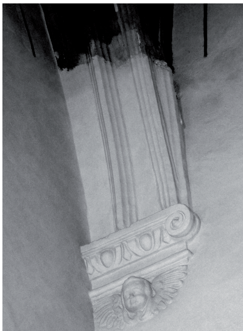
Il. 11. Południowo-wschodni narożnik nawy. Relikty dawnej dekoracji sklepiennej, (fot. autor, 2015)

Wymowa ideowa verae effigiei była zbieżna z widocznym w tym okresie dążeniem do dedykowania kaplic grobowych św. Annie 67 . Wezwanie zyskiwało szczególne znaczenie w kontekście kultu świętej – uznawanej zarówno za patronkę dobrej śmierci, jak i rodzin – co zdaniem Jerzego Łozińskiego mogło być uwzględniane przy fundacjach mauzoleów, w których składano szczątki przedstawicieli konkretnej rodziny 68 . Egzemplifikację powyższej praktyki stanowi kościół w Buczku, uznawany za najstarszy na ziemiach Polski Środkowej przykład układów in modum crucis z parą symetrycznych, przesklepionych kopułami kaplic 69 . Realizacja datowana jest na drugą dekadę XVII wieku, jakkolwiek czas powstania kaplicy Walewskich – wzniesionej na planie czworokąta, dedykowanej Babce Jezusa i przylegającej do południowej partii świątyni – szacuje się na lata 1614-1635 70 . Po północnej