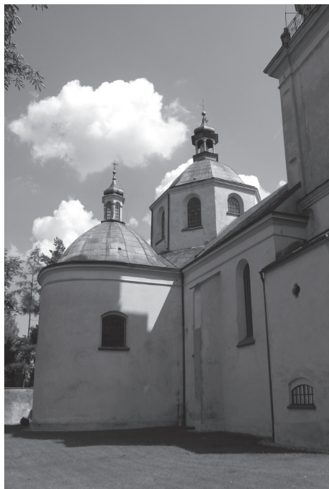
Il.4. Kaplica północna. Widok od strony zachodniej, (fot. autor, 2014)

Podwójne stopnie oraz metalowe kraty z drewnianymi zwieńczeniami przyczyniają się do wyraźnego wyodrębnienia z osi podłużnej kaplic transeptowych 36 . O ich znacze-