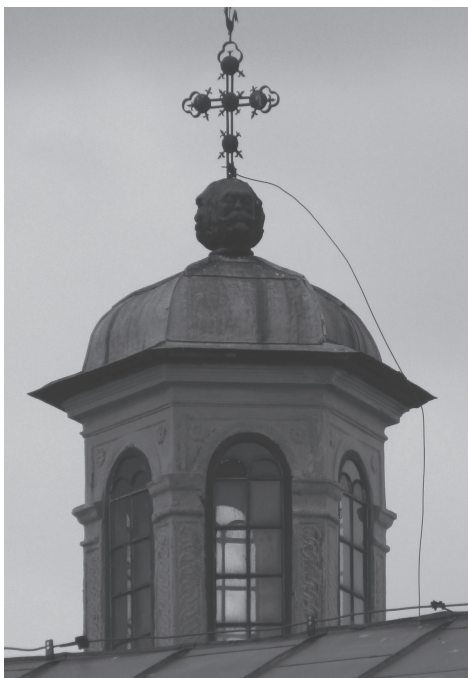
Il.5. Latarnia nad kaplicą południową.

niu świadczą widoczne dopiero we wnętrzach, bogato zdobione kopuły z latarniami, a w przypadku kaplicy północnej usytuowany na wprost wejścia ołtarz ze słynącą łaskami figurą. Miejsce przechowywania wizerunku pozostaje głównym punktem sanktuarium. Jego rangę może podkreślać akcentowanie przestrzeni środkowej, dzięki któremu kaplice transeptowe zostały niemal zrównane z prezbiterium. Opisane wrażenie staje się odczuwalne dopiero pod oktogonálną kopułą.