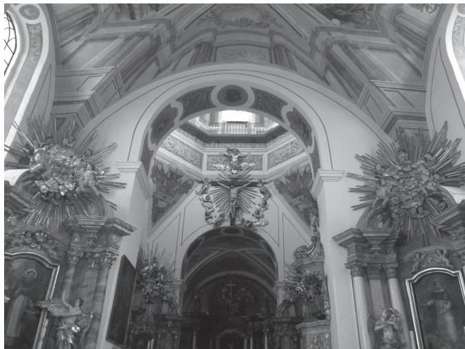
Il. 6. Widok z nawy na przestrzeń centralną, (fot. autor, 2014)

rzony – stwarza wrażenie celowej, świadomej reżyserii przestrzeni i wpływa na jej recepcję. Kolejne części łączące się arkadami ze strefą podkopiulową zdają się być w mniejszym stopniu doświetlone. Czytelność kaplic osłabiają również kraty stające się przyczyną dodatkowego zaciemnienia. W skrytym w niemal zupełnym mroku prezbiterium znajduje się tylko jedno okno doprowadzające światło dzienne z zewnątrz, usytuowane w ścianie północnej. Otwory okienne widoczne po przeciwległej stronie prowadzą do pomieszczeń klasztornych, przez co zatraciły właściwą funkcję. Okna znajdujące się w chóрку zakonnym zostały z kolei w pełni zasłonięte nastawą ołtarza z około 1740 roku 38 . Według pierwotnego zamysłu, przed wzniesieniem murowanych zabudowań klasztornych w obecnej postaci po stronie południowej, prezbiterium było najprawdopodobniej znacznie jaśniejsze. Na osi kościoła mogło znajdować się dodatkowe okno – niewykluczone, że ołtarz główny ustawiony był wówczas bezpośrednio pod łukiem tęczowym 39 .