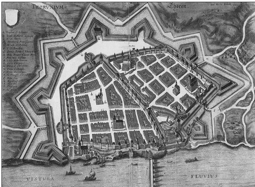
Ryc. 3. Toruń. Prospekt Meriana z 1641 r.

Drugi etap prac fortyfikacyjnych Torunia związany był z działalnością Szwedów na tym terenie i rozpoczął się w latach 40. XVII w. Wówczas, poza ówczesnymi murami miasta, podjęto budowę nowoczesnych, ziemnych fortyfikacji bastionowych. W konsekwencji tego przedsięwzięcia cały Toruń otoczony został półkołem nowożytnych umocnień systemu staro holenderskiego, składającego się z ośmiu wielkich pięciokątnych bastionów połączonych kurtykami (rys. 3). W 1793 r., w wyniku drugiego rozbioru Polski, Toruń znalazł się pod panowaniem pruskim. W 1815 r., po krótkim okresie Księstwa Warszawskiego, ponownie został przyznany Prusom. Wydarzenia te rozpoczęły powolny proces przekształcania miasta mieszczan i kupców w nadgraniczną twierdzę, co nie pozostało obojętne dla jego struktury przestrzennej.