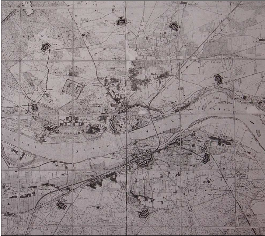
Rys. 5. Twierdza fortowa po zakończeniu pierwszego etapu budowy w 1884 r.