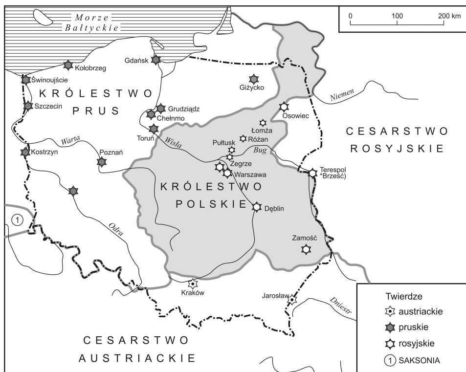
Rys. 2. Dzieła obronne na ziemiach polskich w okresie 1772–1915

politycznej Europy. Wówczas, z racji położenia okupowanych ziem polskich na pograniczu trzech mocarstw, jak i dla utrzymania władzy nastąpił intensywny rozwój nowoczesnych fortec. Trzy różne wzorce i doświadczenia w zakresie techniki fortecznej sprawiły, iż Polska odziedziczyła po okresie zaborów niezwykle bogactwo architektury obronnej. Do dzieł pruskich i niemieckich powstałych w omawianym okresie należy zaliczyć Twierdzę Grudziądz, Toruń, Poznań, Twierdzę Boyen w Giżycku, fortyfikacje Chełmna, zmodernizowane twierdze w Kostrzynie nad Odrą i w Głogowie oraz rozbudowę starych twierdz nadmorskich w Gdańsku, Świnoujściu i Kołobrzegu. Spośród dzieł obronnych rosyjskich warto wymienić Cytadelę Warszawską, rozbudowaną do twierdzy fortecznej, twierdze w Modlinie i Zegrzu, twierdze w Osowcu i Dęblinie, przebudowę twierdzy Zamość, forty w Terespole oraz forty w Pułtusku, Różanie i Łomży (ufortyfikowana linia rz. Narwi). Natomiast austriacką architekturą obronną omawianego okresu reprezentują twierdze w Krakowie i Przemyślu (rys. 2) (Bogdanowski 2002; Rohrscheidt 2009).