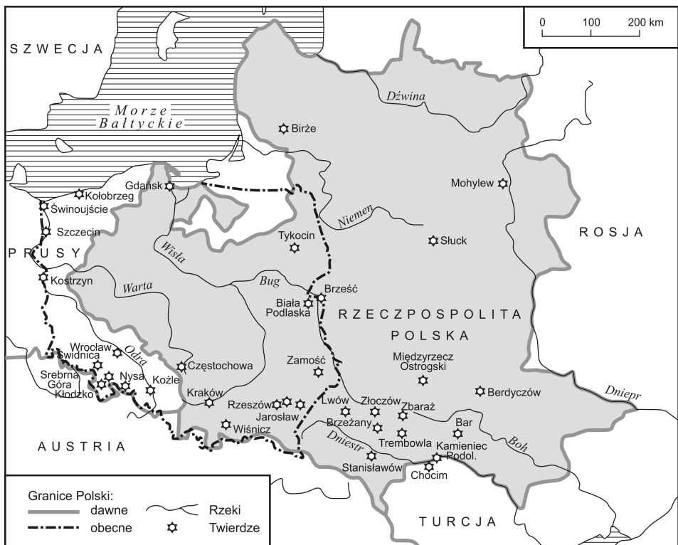
Rys. 1. Polskie i obce twierdze nowożytnie do roku 1772

klasztory–twierdze w Częstochowie, Barze, Berdyczowie, Jarosławiu i Leżajsku. Ponadto okazałe fortyfikacje nowożytnie otrzymywały również rezydencje magnatów, łącząc w sobie cechy reprezentacyjnego pałacu i prywatnej twierdzy (m.in. w Łańcucie, Wiśniczu i Rzeszowie). Niestety, w następstwie późniejszych przesunięć granic kraju na zachód niewiele spośród ówczesnych znakomitych dzieł obronnych znajduje się nadal na terytorium Polski. Równoległe z dziełami wznoszonymi przez Rzeczpospolitą jej zachodni sąsiedzi – Prusy oraz Austria – wznosili na ziemiach, należących obecnie do Polski, własne obiekty obronne, z których znaczna liczba przetrwała do dziś. Spośród nich warto wymienić m.in. fortyfikacje w Świnoujściu, Szczecinie, Kołobrzegu, Kostrzynie nad Odrą, Głogowie, Wrocławiu, Świdnicy, Kłodzku, Srebrnej Górze, Nysie czy Koźlu (rys. 1).