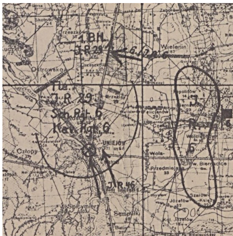
Ryc. 3. Fragment mapy sztabowej niemieckiej 30 DP z zaznaczonym atakiem 6/6 pp na 1 batalion 29 pp