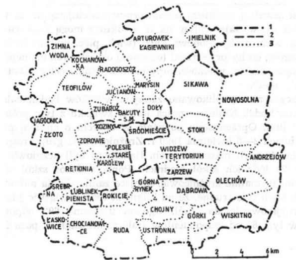
Rys. 1. Zastosowany w artykule podział terytorialny: 1 – granice Łodzi, 2 – granice dzielnic, 3 – granice terytoriów